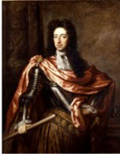
William Paterson, comerciante (izquierda), quien sería más tarde el banquero del rey Guillermo III de Inglaterra (derecha).

Sólo bastaba que el sistema se extendiese y que los comerciantes confiaran en la fiabilidad del sistema para dar nacimiento a la estafa bancaria.