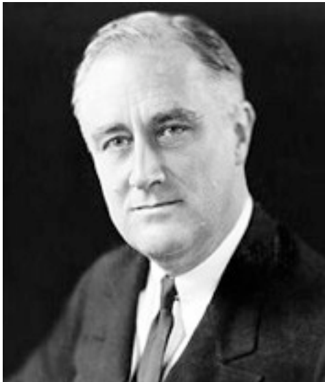
Franklin Delano Roosevelt

Pero volvamos al asunto dejando en el aire lo prometido a Inglaterra y lo prometido a los dirigentes estadounidenses de la época; en definitiva sus pupilos o esbirros, lo cierto que los usureros son los causantes del crack de 1929 para convencer a los políticos de la rigidez que supone que el dólar tenga un equivalente en plata y oro, tal como reconocía la constitución y las normas internacionales al respecto (1 dólar es una medida farmacéutica de 371gramos de plata, a igual a 24,7 en oro, igual a dólar español de Miller, el Deker holandés, etc.).