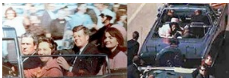
John Fitzgerald Kennedy

Kennedy conjuro, con su Secretario del Tesoro, producir dólares en relación a la reserva de oro y plata existente, y así salieron unos billetes (4.292.893.815 de 1 y 2 pues los de 10 y 20 jamás llegaron a salir) con numero de serie en rojo (los de la Reserva Federal son en verde)